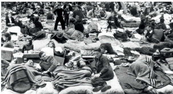
Auf engstem Raum: Vertriebenenlager in der US-Besatzungszone, 1946*

zahllosen Heimatkreisen organisiert. Dabei hat der Freistaat Bayern die Schirmherrschaft über die Sudetendeutschen als „Viertem Stamm“ und die Patenschaft für Ostpreußen übernommen. Neben der Sudetendeutschen Landsmannschaft und der Landsmannschaft der Ost- und Westpreußen gibt es in Bayern die Schlesische Landsmannschaft, die Landsmannschaft der Oberschlesier , die Pommersche Landsmannschaft, den Bund der Danziger und die Deutschbaltische Landsmannschaft sowie die Landsmannschaften der Banater Schwaben , der Siebenbürger Sachsen , der Sathmarer Schwaben , der Ungarndeutschen , der Donauschwaben , der Karpatendeutschen aus der Slowakei , der Karpatendeutschen aus Ruthenien (Karpatenukraine) und der Deutschen aus Russland .