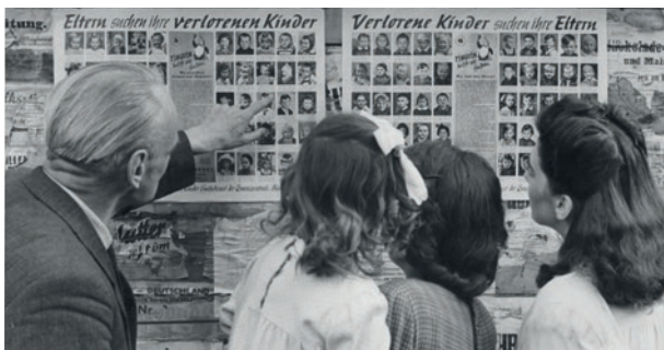
Verschollen auf der Flucht: Kinder-Suchdienst der Zentralstelle München, 1945/1946*

Völlig mittellos kamen die Vertriebenen in ein zerstörtes Land, in das, was von Deutschland nach dem Krieg übrig geblieben war, und zu einem kleinen Teil auch nach Österreich. Doch woher kamen sie eigentlich genau? Die Mehrheit der Vertriebenen stammte aus den „ehemaligen deutschen Ostgebieten“, den Teilen des Deutschen Reiches, die nach dem Krieg Polen und der Sowjetunion zugeschlagen wurden. Sie wurden aus Schlesien, Pommern und Ostpreußen vertrieben, und nur in Oberschlesien verblieb nach dem Krieg noch eine geschlossen siedelnde deutsche Minderheit. Auch die Tschechoslowakei vertrieb „ihre“ Deutschen, die dreieinhalb Millionen Sudetendeutschen aus Böhmen und Mähren und die Karpatendeutschen aus der Slowakei. Im Osten des Deutschen Reiches und im Sudetenland hatten die Deutschen seit Jahrhunderten in