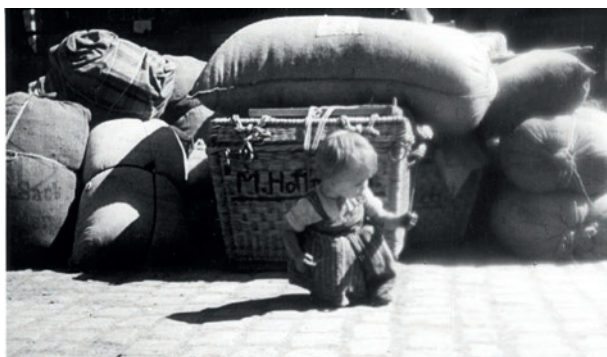
Kleines Mädchen vor den letzten Habseligkeiten Vertriebener, 1946*

Völlig mittellos kamen die Vertriebenen in ein zerstörtes Land, in das, was von Deutschland nach dem Krieg übrig geblieben war, und zu einem kleinen Teil auch nach Österreich. Doch woher kamen sie eigentlich genau? Die Mehrheit der Vertriebenen stammte aus den „ehemaligen deutschen Ostgebieten“, den Teilen des Deutschen Reiches, die nach dem Krieg Polen und der Sowjetunion zugeschlagen wurden. Sie wurden aus Schlesien, Pommern und Ostpreußen vertrieben, und nur in Oberschlesien verblieb nach dem Krieg noch eine geschlossen siedelnde deutsche Minderheit. Auch die Tschechoslowakei vertrieb „ihre“ Deutschen, die dreieinhalb Millionen Sudetendeutschen aus Böhmen und Mähren und die Karpatendeutschen aus der Slowakei. Im Osten des Deutschen Reiches und im Sudetenland hatten die Deutschen seit Jahrhunderten in