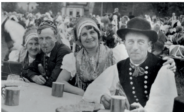
Geselligkeit in der alten Heimat: Trachtengruppe in Braunau (Böhmen), 1930er Jahre*

Knapp zwölf Millionen Heimatvertriebene fanden von 1944 bis 1948 Aufnahme im Gebiet der späteren Bundesrepublik, in der sowjetischen Besatzungszone und nachmaligen DDR und in Österreich. Etwa 1,9 Millionen von ihnen kamen nach Bayern, mehr als die Hälfte davon aus Böhmen und Mähren, aber auch aus Schlesien und anderen deutschen Siedlungsgebieten im Osten. Beide Seiten, sowohl der Freistaat als auch die Heimatvertriebenen – die sich allmählich damit abfanden,