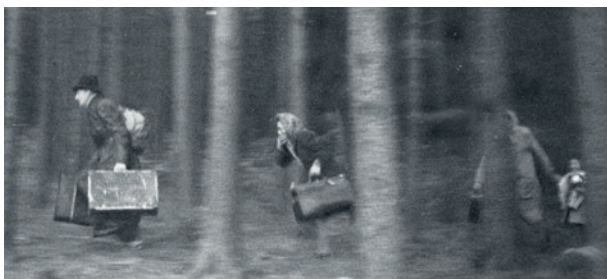
Flucht über die Grenze in das vertriebene Deutschland, 1945*

Was bedeuten eigentlich diese Worte: Vertriebene und Aussiedler ? Wer verbirgt sich dahinter? Gerade jüngere Menschen können sich oft nicht mehr viel darunter vorstellen. Nicht selten kommt es sogar zu regelrechten Begriffsverwirrungen und manch einer denkt dabei eher an die Flüchtlinge unserer Tage, die, meist aus fernen Ländern kommend, in unserem Land Zuflucht suchen. Nein, die Vertriebenen und Aussiedler sind weder Migranten noch Geflüchtete in dem heute gebräuchlichen Wortsinne. Sie haben eine ganz andere, eigene und besondere Geschichte.